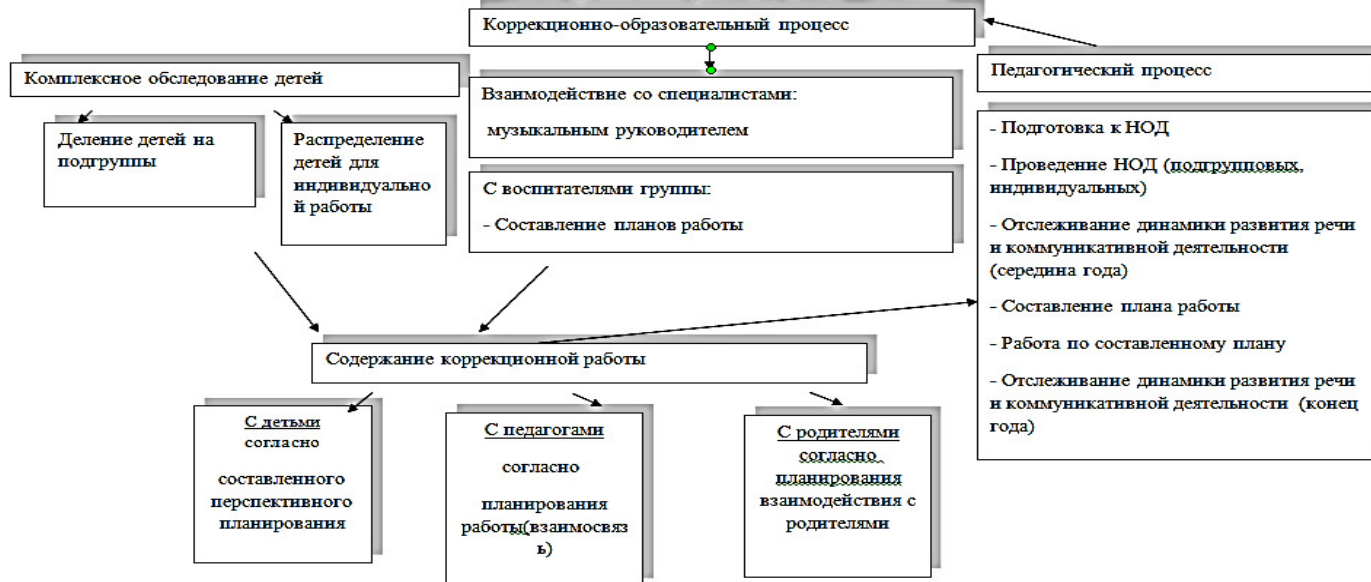
Схема организации работы педагога – психолога