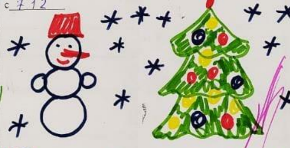
СХЕМА "ПРИЗНАКИ ЗИМЫ" ОПЫТ "ПОЧЕМУ СНЕГ СКРИПИТ"