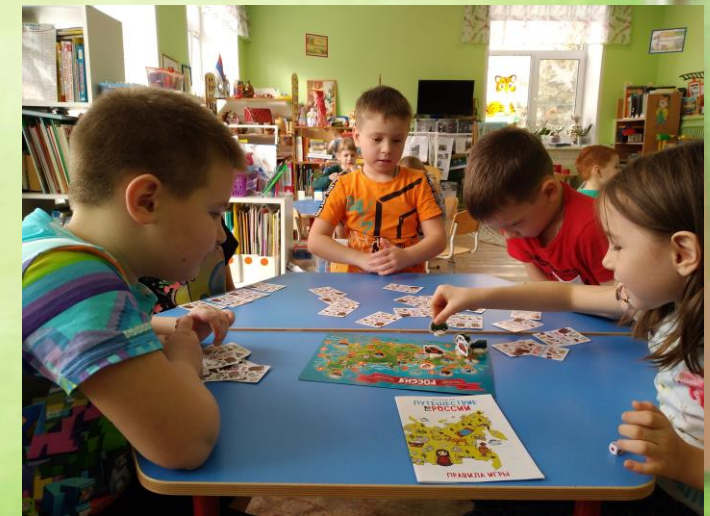
Игра «Путешествие по России»