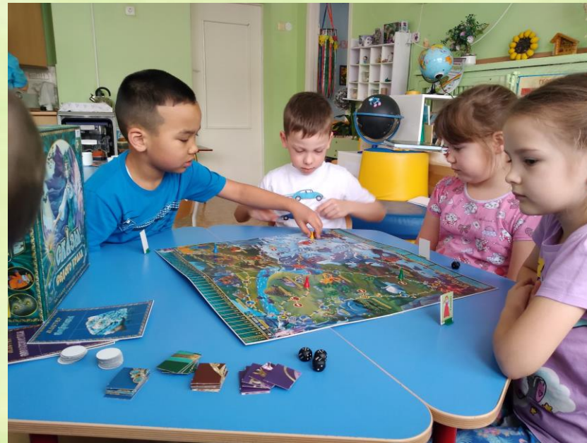
Настольная игра «Кладовая Урала»