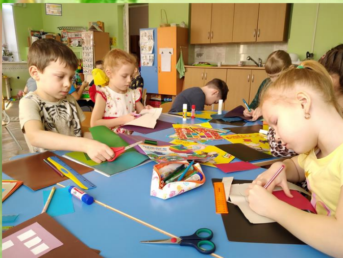
Аппликация «Мой город»