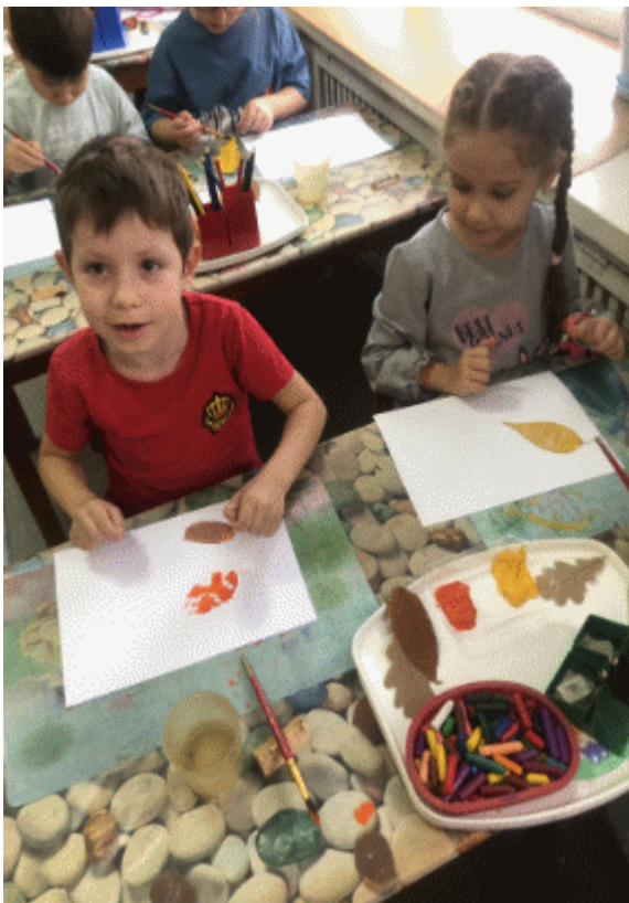
Фото 1. Фото 2